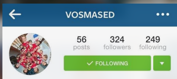
10.a klass @vosmased