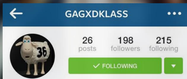
10.d klass @gagxdklass