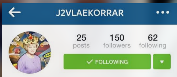
10.c klass @j2vlaekorrar