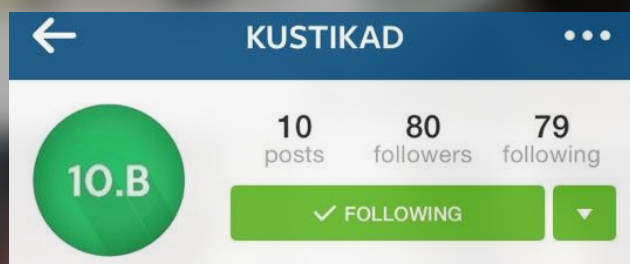
10.b klass @kustikad